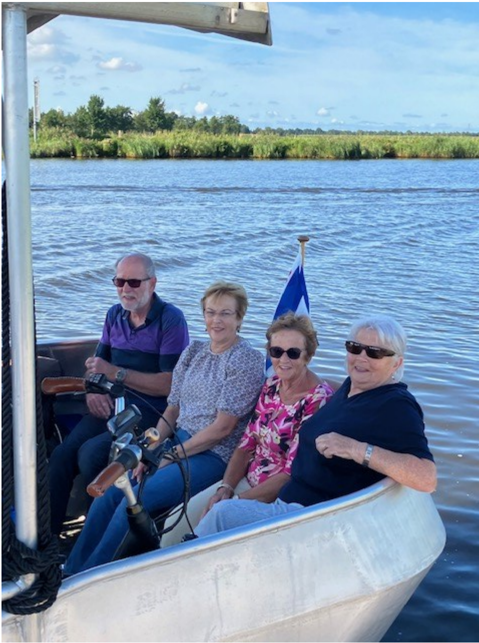
Pontje Schalkdiep: veilig naar de overkant