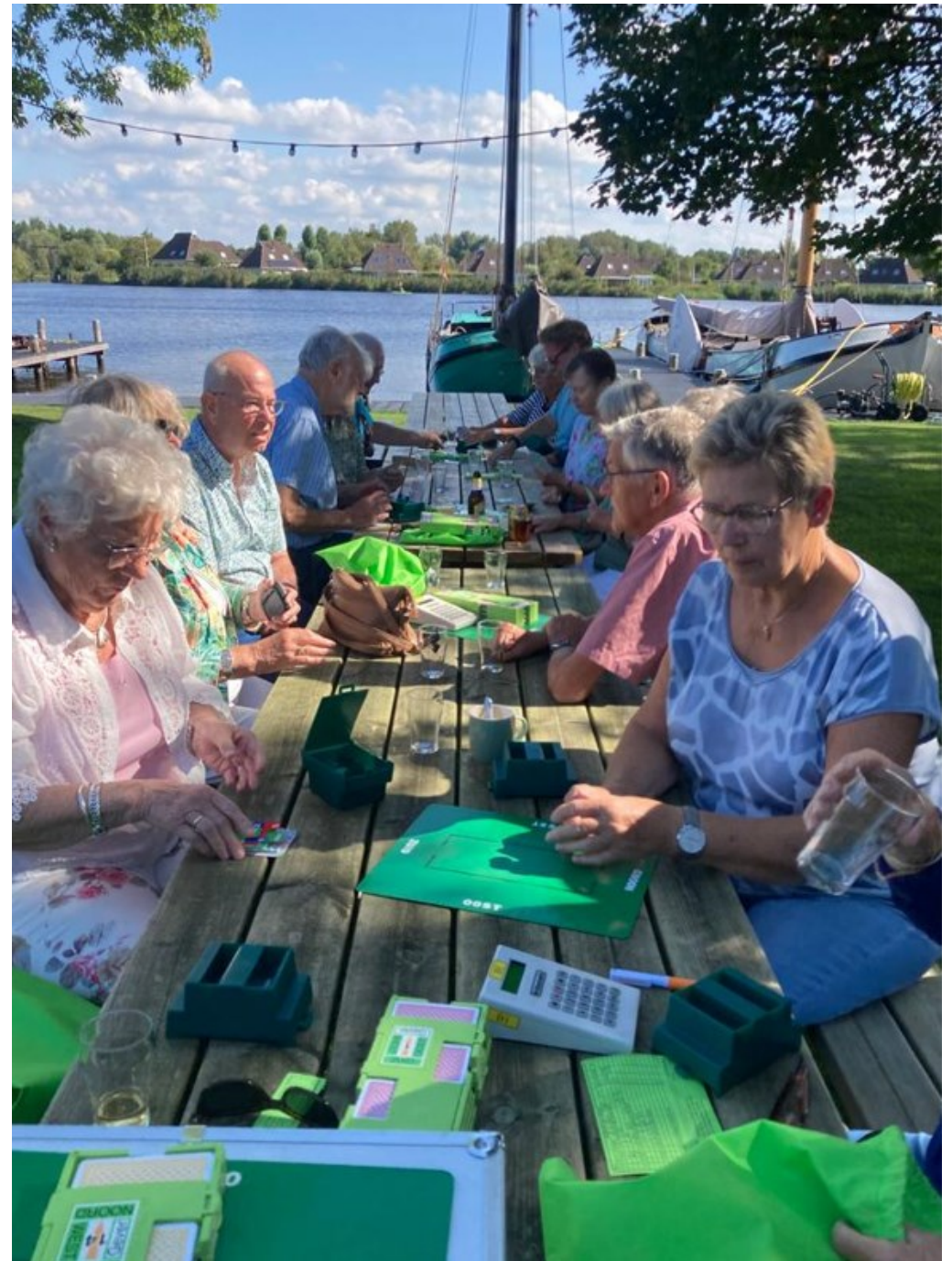
Bridgen aan het water bij zeilschool Annage

Tj. Geartsstraat 9 Rijksstraatweg 126 Leeuwerikstraat 147 Archipelweg 44