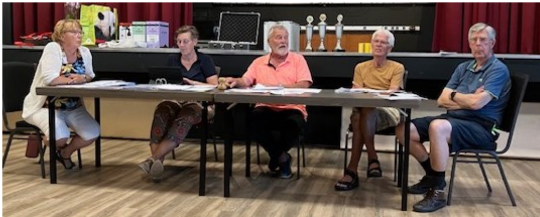
Ons bestuur voor de aanvang van de A.L.V.